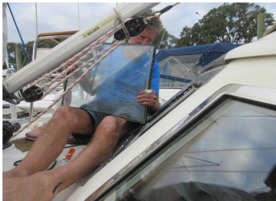
Tre av våra rutor i pilothuset behövde bytas ut då det kommit fukt mellan de två glasen i rutorna.

Vi besökte också vingårdarna kring staden Napier där vi passade på att besöka flera av vingårdarna. Vi valde att följa med en dagstur och guiden var duktig, gruppen liten och vinet gott! Vi såg också geotermiska området vid norra stranden på Lake Taupo och Roturoa en bit norr därom. Det var häftigt att se varmt vatten som sprutade ut ur jorden och bada i poler värmda med det varma svavelhaltiga vattnet.