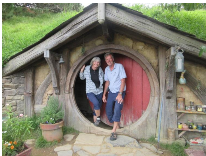
Vi har just varit och besökt Hobbitarna som bor i huset här!

Rutorna måste tas ut, mallar tillverkas och lämnas in så glasmästaren kunde göra nya rutor. Teaklisten (ca 25 meter x 10 cm) går runt båten och först måste lacken tas bort, sen skall teaken slipas och sist lackas många gånger. Båda arbetena kväver uppehållsväder, när det regnar får vi hitta på något annat. Mallarna