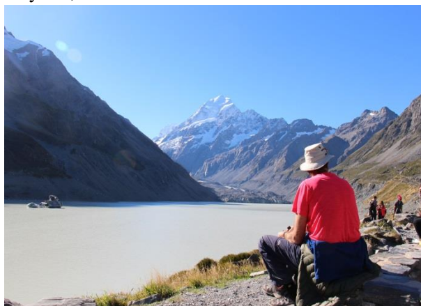
På Sydön var bergen högre och det fanns många vandringsleder i bergen.

Vi fortsatte färden längs kusten, kom till Bluff som är känt för två saker, ostron och att det är den sydligaste punkten på Nya Zeeländska fastlandet. Vi hade tur som var här i april, säsongen för de goda ostronen är från april