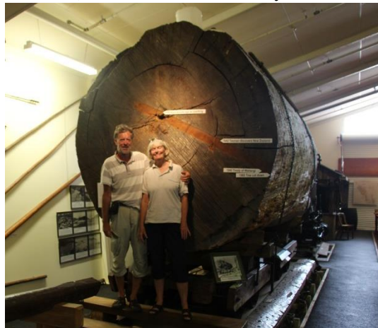
Kauritredet vi står vid började växa på 1100-talet!