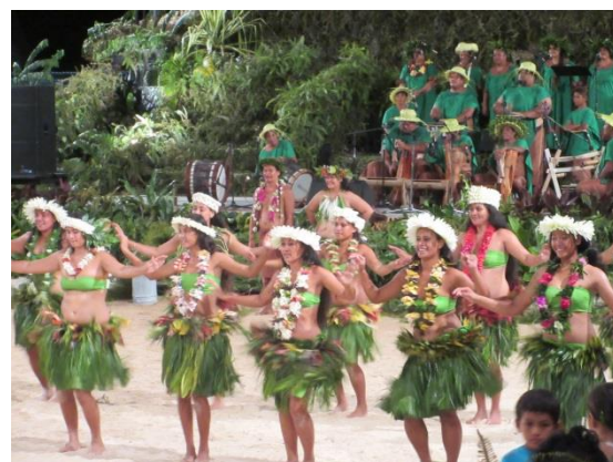
Heiva på Huahine, årets bästa dansgrupp

Vi hyrde en scooter och åkte runt ön, vilket med stopp här och där tog nästan sex timmar. Vi var på tok för stora för scootern, så det var rätt obekvämt. Men vi såg gamla kultplatser, de gamla fångstmetoderna med labyrinter där fiskarna inte hittade ut, de heliga ålarna med blå ögon, en vaniljodling och vacker natur. På slutet började det regna så vi var rätt blöta när vi lämnade tillbaka scootern. Men kul var det, fast nästa gång vi vill se oss omkring blir det per bil.