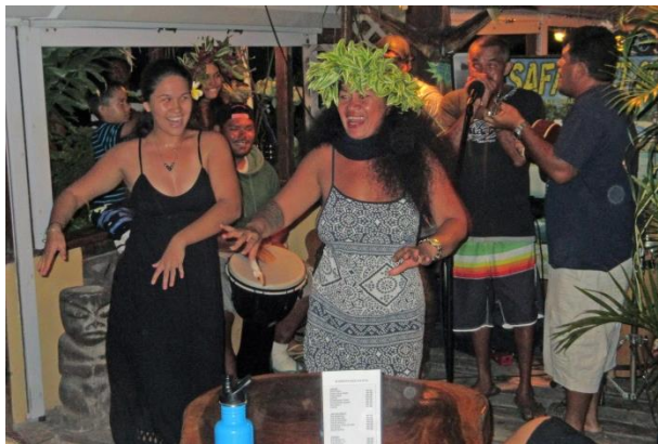
Uppträdande på den lokala baren – Happy Hour

Den 17 juli fortsatte vi med en nattsegling till ön Huahine, ca 100 sjömil norr ut. Vi var inte ensamma, vi såg många lanternor under natten, många passade på i gynnsamma seglingsvindar. Seglatsen gick fort, vi fick sakta ner lite för att anlända i dagsljus. Även om pilotboken säger att det går att angöra i mörker föredrar vi att kunna se hur det ser ut när vi närmar oss land. Vi gick in genom revet som omger ön och