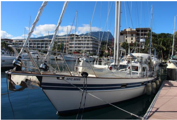
Marinan i Papeete, Tahiti