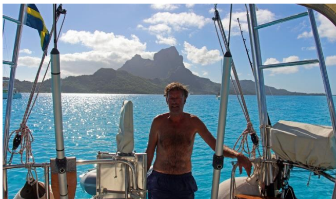
Bora-Bora, ön vi drömde om när vi byggde Randivåg

Från Taha kan man se över till Bora Bora som ligger ca 20 sjömil bort. Och den 7 augusti seglade vi dit och ankrade mellan ön Motu Toopu och revet tillsammans med många andra seglare. När vi höll på att