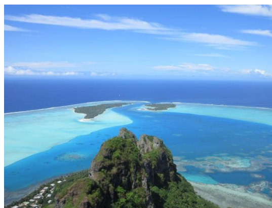
Inseglingen till Maupiti, från toppen av ön

Vädret såg lugnt ut så vi valde att segla till nästa ö – Maupiti – efter att ha klarerat ut från Franska Polynesien i Bora Bora. Maupiti tillhör också Franska Polynesien men det går inte att klarera ut där. Ön har en smal och grund öppning i revet runt ön som gör att det endast går att komma in i lugnt väder. Vi hade en lugn segling och inpassering i revet och snart var vi ankrade tillsammans med de andra båtarna. På kvällen försökte vi gå och äta på en restaurang tillsammans med besättningarna på Time Bandit från Skottland och Omweg från Holland, men restaurangen var stängd. Vi kunde handla färdiglagad mat att ta med oss i en kiosk och vi åkte sen till Randivåg och åt. Trots uteblivet restaurangbesök hade vi en trevlig kväll. Vi upprepade försöket med restaurangen nästa dag men restaurangen var fortfarande stängd. Då fick vi en ”sundowner” på Time Bandit och åkte sen tillbaka till respektive båt och lagade mat.