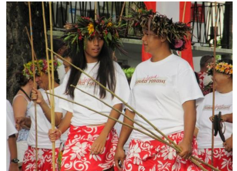
Paraden den 29 juni inleder Heiva på Tahiti

Den 29 juni såg vi på paraden som man har med anledning av ”självstyrets dag”, dvs den dag då Franska Polynesien fick ett visst mått av självstyre från Frankrike. Denna dag inleder också festivalen ”Heiva” som pågår hela juli. Heiva innebär tävlingar i paddling, bära sten, kasta spjut, klyva kokosnötter m m, samt sång och dans. Heiva firas på alla öar i Franska Polynesien, men störst är det på Tahiti.