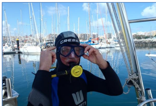
Botten gjordes ren med nya dykutrustningen

Sista kvällen på karnevalen var ”begravningen av sardinen”, samma sed som vi var med om i La Coruña. Ett sorgetåg gick genom staden med en stor sardin (gjord av papp och pinnar) ner till stranden där