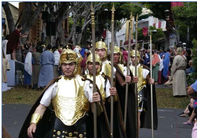
Vakterna som för Jesus ner till platsen där han korsfästes