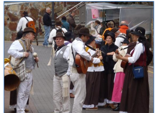
Spelglädjen var stor vid Mandelfestivalen

om "förr i tiden", folk som kom tillbaka från "nya världen" och tyckte de var förmer än sina gamla kompisar etc. Men vi fick inte riktigt ihop historien med gårdagskvällen.