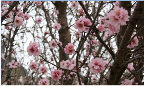
Rosa mandelblommor ger bittermandlar

Vi börjar känna oss hemma i Las Palmas, Gran Canaria, vi grejar i båten, umgås med vänner och tar det lugnt. Vädret är omväxlande, ibland regn, lite kallt och så emellan riktigt varmt och soligt väder. Vi hyrde bil några dagar och körde runt ön och promenerade i bergen och tittade på de blommande mandelträden. Den 14 januari blev det en ny resa till Göteborg och väl tillbaka i Las Palmas den 28 började vi förbereda kommande seglingar och startade med att köpa ny fiskeutrustning, spö, hållare, drag (sqiud med dubbelkrokar) och harpungevär. Drag i olika storlekar införskaffades, ju större drag, ju större fisk!