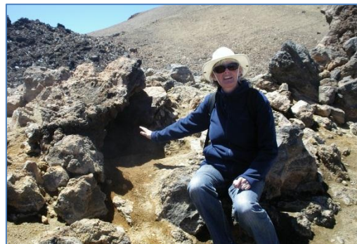
Varm luft kommer ur marken ända upp på Teide

Vi hyrde bil en vecka och åkte runt på Teneriffa, var bland annat uppe på Teide, snirklade oss igenom Mercedeskogen och åt fisk vid en liten by uppe i nordväst, tittade på pyramiderna i Güimar, åt middag på en restaurang ägd av en kille som hade sin familj i Göteborg och solade i Los Cristianos. Det var en hektisk vecka men efter att ha vilat några dagar flyttade vi oss den korta biten till hamnen Las Galletas . Här blåser det lite mindre än i San Miguel och hamnen ligger mitt i stan så det är mycket lättare att handla mat och annan förnödenhet. Det första man kom till