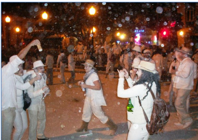
Vita kläder, talkburkar och kamera på Carnaval Traditional