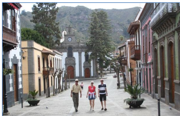
På promenad i Teror – en lugn stad!