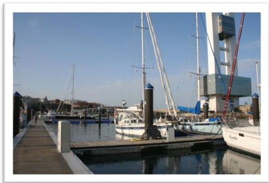
Lugn dag i Marina Coruña.

vi blev bjudna på andra svenska läckerheter. Att handla på IKEA är en stor hjälp när man vill ha svensk mat och är långt hemifrån, på IKEA utanför Sverige finns ett utbud av svenska matvaror.