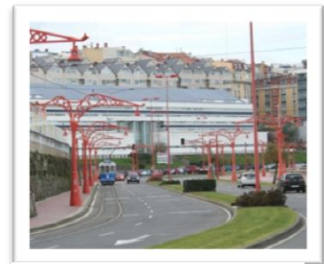
Spårvagnen går längs hela strandpromenaden.

Första tiden i La Coruña ägnade vi åt att lära känna staden. Per cykel och till fots korsade vi stan på längden och tvären. Vi cyklade på varenda gata i centrum, tittade in i alla järnaffärer, letade efter tygaffär och besökte den enda båt butiken. Vi letade efter bra matvarubutiker, närmaste bageri, besökte de köpcentrum som fanns, tog en tur till IKEA och letade efter en favoritrestaurang. När vi hade lärt känna staden så började vi beta av vår ”att göra lista”.