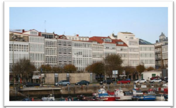
De inglasade balkongerna i La Coruña.

La Coruña är en trevlig stad. Det finns en gammal stadskärna som numera mest består av restauranger och barer. Går man där på kvällen är det mycket folk i rörelse. Går man där på dagen ser det lite slitet ut, men det är ju å andra sidan en gammal stad. Resten av La Coruña är också trivsamt, en blandning av gemytt och stor stad. Staden är känd för sina inglasade balkonger som ger husen ett speciellt utseende. I La Coruña finns tillgång till allt man kan tänka sig, stan har ca 250.000 invånare. Prisnivån är ungefär som i Sverige, maten har kanske lite lägre pris, i varje fall på vissa varor. En fläskfilé till exempel kostar ca 35 kr - de får väl en massa filé över när de skall göra Serranoskinka, den är minsann inte billigare än hemma!