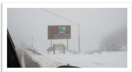
Snöstorm i nationalparken Picos de Europa.

den fantastiska muromgärdade staden Laguardia, som hade mängder av bodegor med vinkällare, var riktigt mysig. Vi gjorde studiebesök på både en liten och en stor vingård och det är ju alltid intressant att se hur det går till att göra vin. Högplatån norr om Madrid var karg och kall, speciellt på