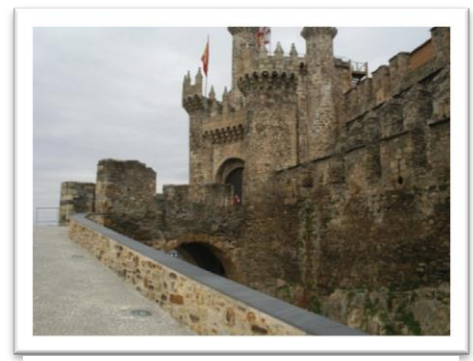
Tempelriddarborgen i Ponferrada.

nätterna. Vi fick skrapa vindrutorna flera mornar i rad vilket är lite svårt när man inte har en is-skrapa. Tur vi hade med oss en bunke med mat som vi åt första dagen, locket gick att skrapa is med! På dagarna blev det över noll grader, men inte många plusgrader. På högplatån fanns flera fantastiska slott och katedraler i fina små byar och städer. När vi körde ner från högplatån såg vi hur det blev mer och mer vår för varje meter vi närmade oss La Coruña. Vi valde rätt vinterhamn!