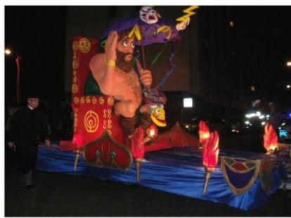
Momo, sista dagen på karnevalen.