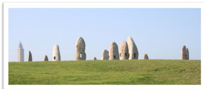
En av La Coruñas många parker med Europas äldsta fyr Torre de Herkules i bakgrunden.

Mellan jobbandet på båten hann vi med lite samvaro med grannarna. Vi blev bjudna på champagne av vår franske båtgranne, men han blev sjuk och vi fick dricka den utan honom! God var den dock, det var hans favoritchampagne. Vi kan rekommendera champagnen Charles de Courance – brut . Våra svenska båtgrannar fick både ärtsoppa och semlor och