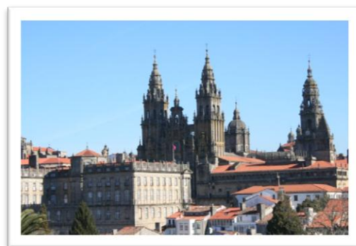
Katedralen i Santiago de Compostela.

I början av februari besökte vi Santiago de Compostela, en pilgrimsstad inte långt från La Coruña. År 813 upptäckte man här graven efter aposteln sankt Jacob (Santiago på spanska) och det dröjde inte länge förrän pilgrimerna började komma och en stad växte fram. Santiago är en helt förtjusande gammal stad innanför en ringmur. Små smala gränder, gamla hus som fortfarande ändvänds som bostadshus och butiker och ringlande kullerstengator. Det är katedralen som är huvudattraktion och den är verkligen imponerande. Den byggdes mellan åren 1075 och 1211 och har sedan byggts på och om. Här finns också många gamla kyrkor och kloster, många används idag av hotell, universitet, museum eller något annat "offentligt". Man bor och verkar fortfarande i den gamla delen av staden vilket gör att den får en speciell atmosfär. Här finns flera universitet och mycket kultur, lite likt Uppsala och Lund. En riktigt intressant och spännande stad!