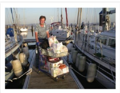
Lite av all mat och dryck som vi bar ombord före avgång.