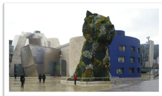
Utanför entrén till Guggenheimmuseet.