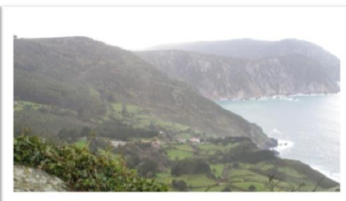
Nordkusten på Spanien, hög och karg.

I slutet av februari och början av mars hyrde vi bil och reste runt norra Spanien. Vi började med att köra längs kusten från La Coruña till Bilbao. Det var roligt att se kusten från bil, vi har ju sett nästan hela denna kust från sjösidan. Vi besökte även naturreservatet "Picos de Europa" – ett vilt område med höga berg och rikt djurliv. När vi var där var det kallt – och snö! Vi besökte ett naturreservatskontor där de sa att det inte gick att åka