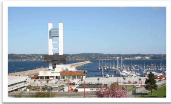
Marina Coruña, med hamnkontoret i två våningar t v.

Vi låg i den yttre marinan, Marina Coruña, precis innanför hamnpiren och det spektakulära hamnkontoret. Marinan öppnades 2009 och det är inte direkt en ”mysig” marina, men personalen är trevlig (och engelskspråkig) och det betyder mycket. Duschar och tvättrum är nya, så även pontoner, bryggor, servicebyggnader och allt annat. De har också mycket personal som kollar bryggor och båtar, dag som natt. Känns tryggt.