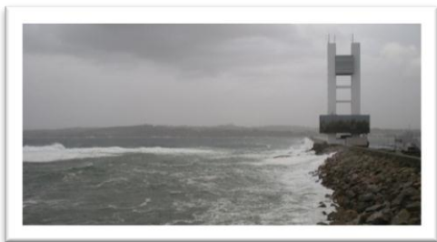
Stora vågor utanför hamnpiren, tryggt innanför.

Marinan var under vintern väl skyddad från både vind och vågor, men vi märkte av dyningen om vågorna i havet var 4 meter eller högre.