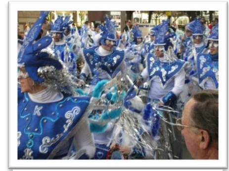
Paraden som inledde karnevalsveckan.

vi inte, men Momo var karnevalskungen, i år en manlig figur. Momo var en stor figur gjord av papp och trä som bars av 6 starka karlar och Momo var med vid invigningen av karnevalen och vid alla upptåg. På karnevalens sista kväll kom ett sorgetåg långsamt gående genom staden med Momo och sardinen (som inte varit med vid något tidigare tillfälle) till en strand. Där ordnades ett bål för Momo och sardinen begravdes i sanden. Sen återgick staden till det normala igen!