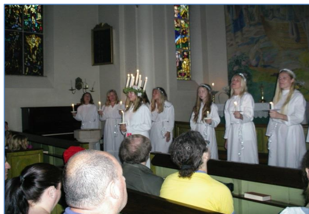
Luciafirande den 15 december

Den 20 december hade restaurangen i Barlovento fest och vi gick dit. Pizza och öl hade utlovats och dans. Vi gick dit, pratade en del med några holländare som var på väg söder ut och hade en trevlig kväll. Men vi hade väntat oss fler gäster, med över 400 medlemmar och 325 segelbåtar i hamnen och endast 75 gäster på en klubb-kväll?