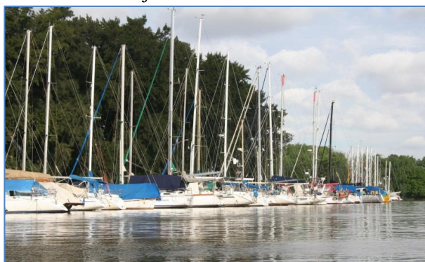
Club de Veleros Barlovento blev vår hamn i ett år.

Yacht Club Argentino (YCA) var en mycket bra utgångspunkt för att utforska Buenos Aires, vi gick omkring och tittade på Plaza del Mayo, presidentpalatset, La Boca och andra sevärdheter. Vi upplevde staden som trevlig och människorna som vänliga. När vår första vecka var slut seglade vi en bit till in i Rio de la Plata, in i det deltaområde som floderna Parana och Uruguay har skapat, till Club de Veleros Barlovento där vi hade fått plats. Barlovento har en skyddad hamn, kostnaderna är rimliga och omgivningarna lugna. Ett bra ställe att ha båten. Vi blev välkomnade i hamnen av de tyska båtarna Meerbaer och Lojan som introducerade oss till båtklubben, omgivningarna och var vi kunde hitta matbutiker,