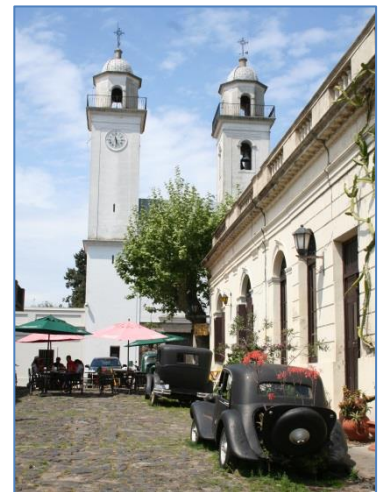
Colonia med några gamla bilar

Vi siktade att gå till Yacht Club Argentino som har en hamn nära centrum av Buenos Aires. Vi hade hört att man kunde få stanna där som gäst i en vecka, och vi fick en plats i hamnen och konstaterade att ryktet om deras gästfrihet stämde. Här fick vi bra information om var vi hittar olika myndigheter och vi börjar besöka dem. Först passpolisen, sen tullen och så "Prefectura Naval", den