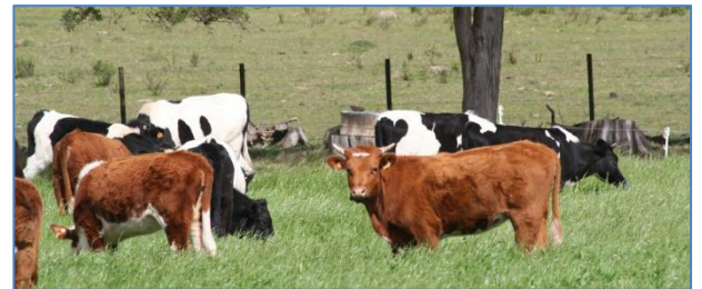
I Uruguay går korna i hagar med gräs upp till magen!