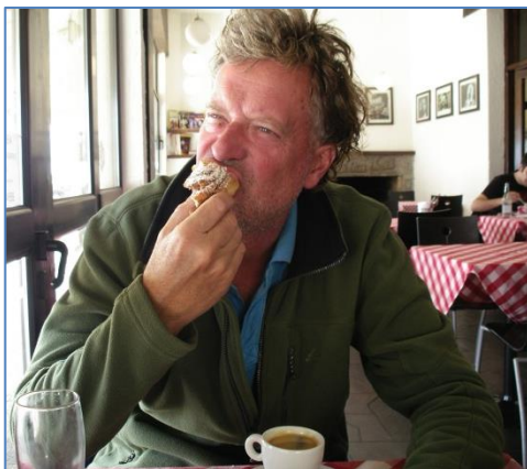
Kanelbullens dag 4 oktober

Den fjärde oktober på kanelbullens dag gick vi förbi en restaurang som hade "kanelbulle" på menyn. Förbryllade gick vi in och ställde den korta frågan "Kanelbulle?" Det visade sig att ägaren till restaurangen hade varit i Sverige i många år och tagit med receptet på kanelbulle till Uruguay! Goda var de och vi kände oss som hemma.