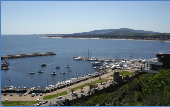
Den fina hamnen i Piriapolis